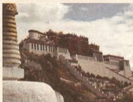
Partido Comunista, Zhang Qingli, citado pela BBC, o Tibete está a entrar numa “idade de ouro” do turismo. C.B.R.

Um “boom” turístico no Tibete: mais de quatro milhões visitaram o território em 2007, um aumento de 60 por cento em relação a 2006. São números oficiais que, diz o Governo chinês, reflectem o investimento em infra-estruturas e em operações de marketing. Para os mais críticos, a “invasão” turística não traz benefícios ao Tibete, significando antes uma, também crescente, destruição do meio ambiente e das características únicas que levam à elevada procura. Já para o secretário local do